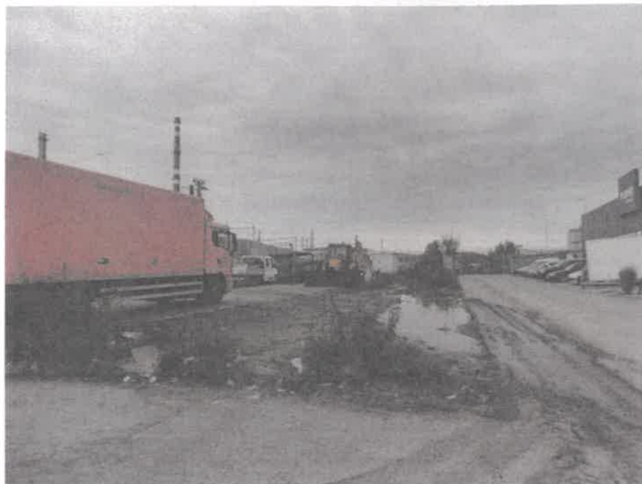
Pozemky na parc. KN-E 1420 a 3735 – pohľad severovýchodný