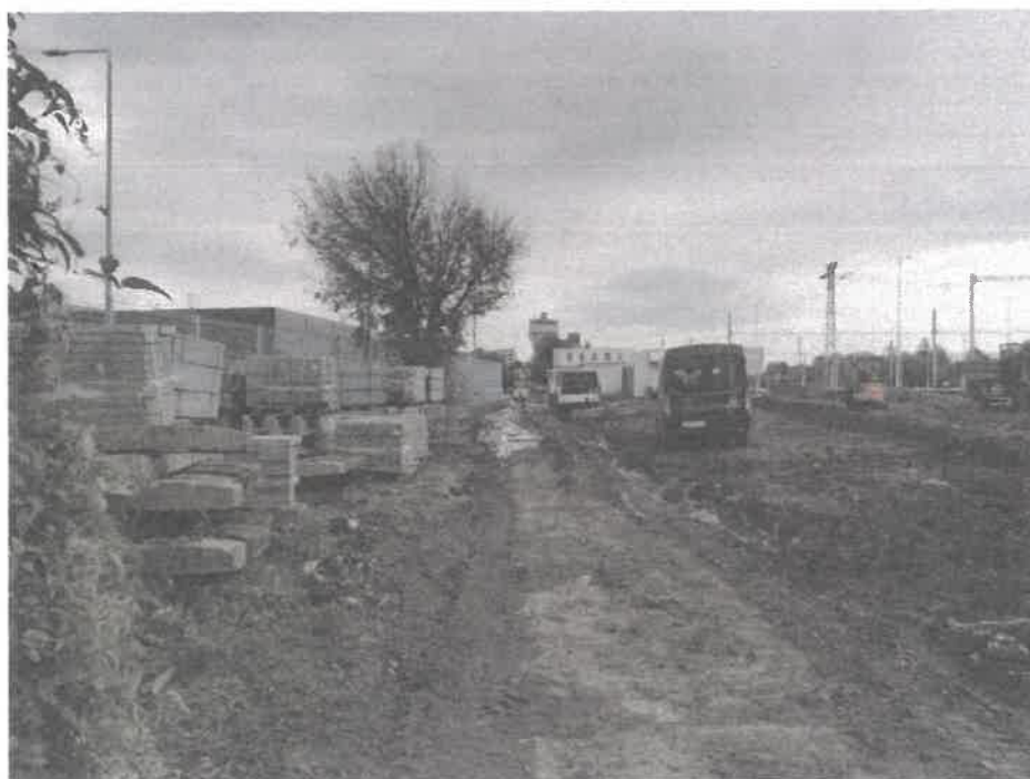
Pozemky na parc. KN-E 1420 a 3735 – pohľad juhozápadný