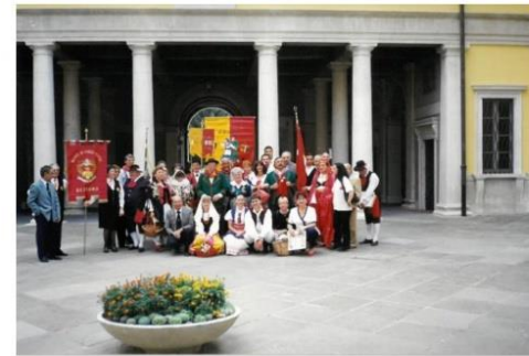
festival Taliansko 1998