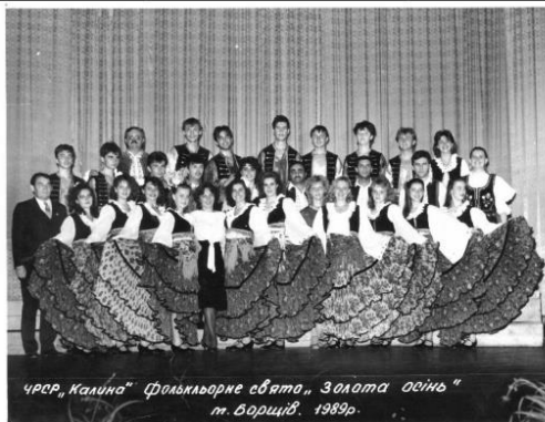
Foto: Emília Čerhitová - Folklorne slávnosti v meste Borščiv Ukrajina 1989