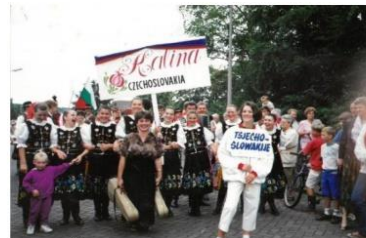
festival Holansko 1992