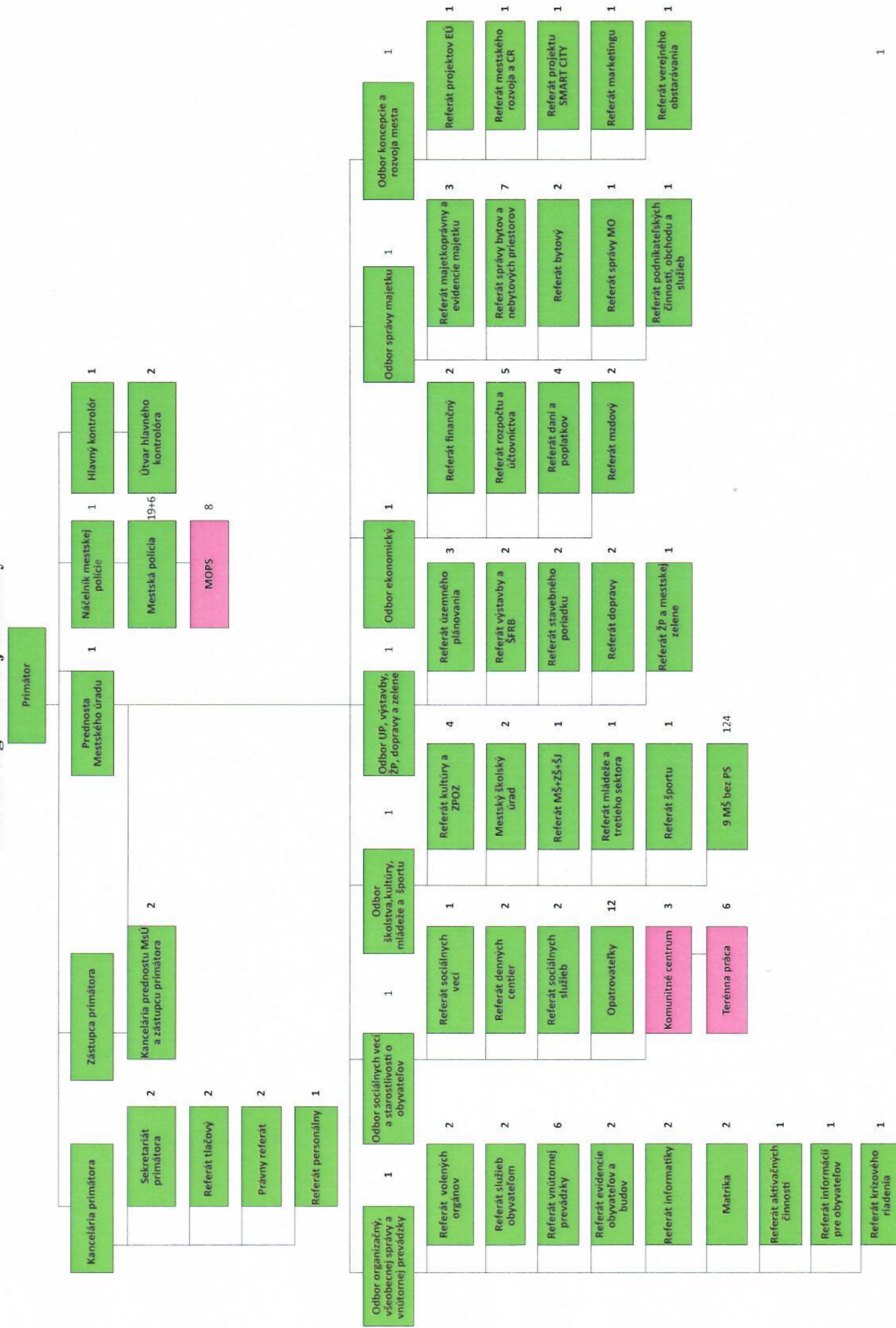
Schéma organizačnej štruktúry